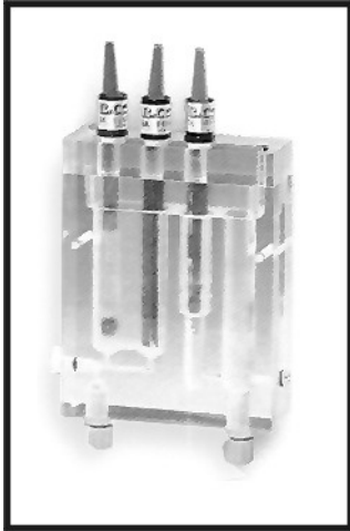
Cela pomiarowa SZ7233